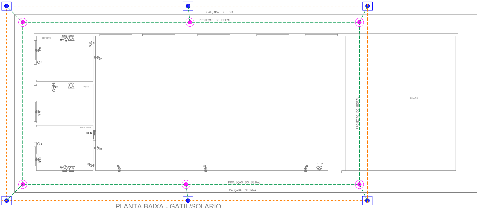
PLANTA BAIXA - GATIL/SOLARIO